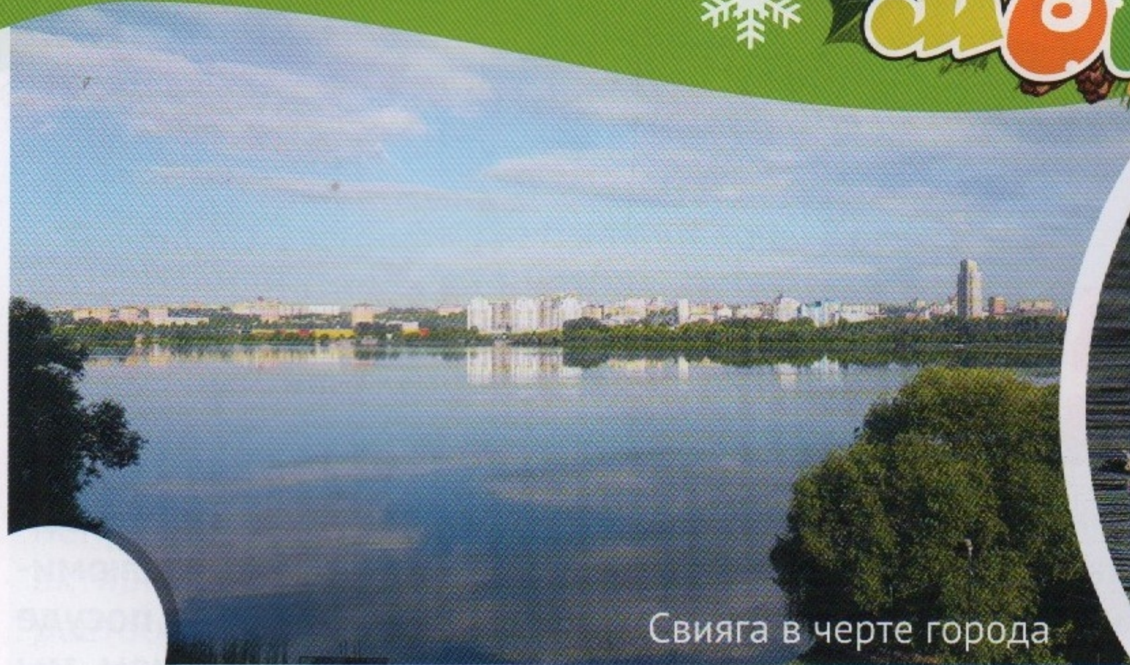
Свияга в черте города