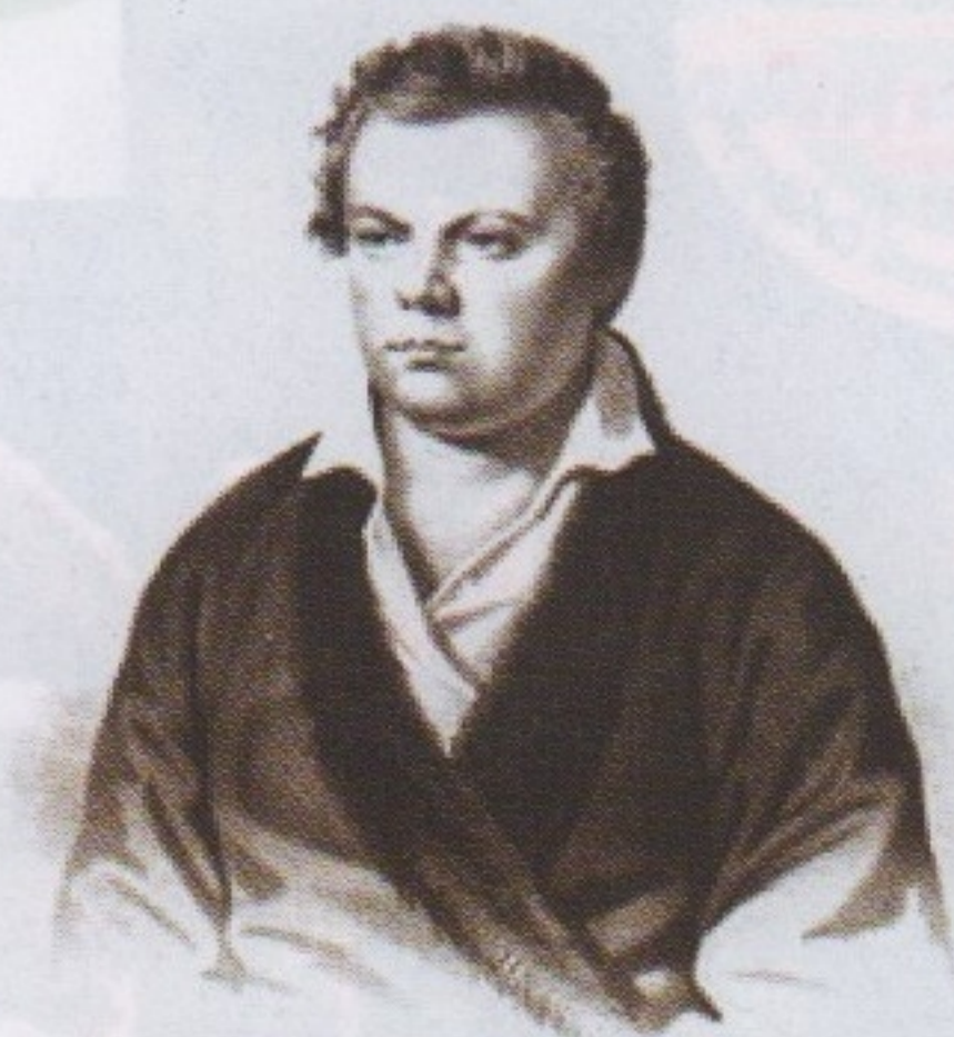
Николай Михайлович Языков (1803-1847)

Дорогой друг, сегодня мы с тобой отправимся по пушкинским местам и заглянем в музей «История села Языково. Братья Языковы», который стал неотъемлемой частью комплекса «Усадьба Языковых». Кстати, недавно исполнилось 217 лет со дня рождения великого поэта, Александра Сергеевича Пушкина. «А как же Пушкин связан с этим местом?» – спросишь ты. Наберись терпения, сейчас узнаешь.