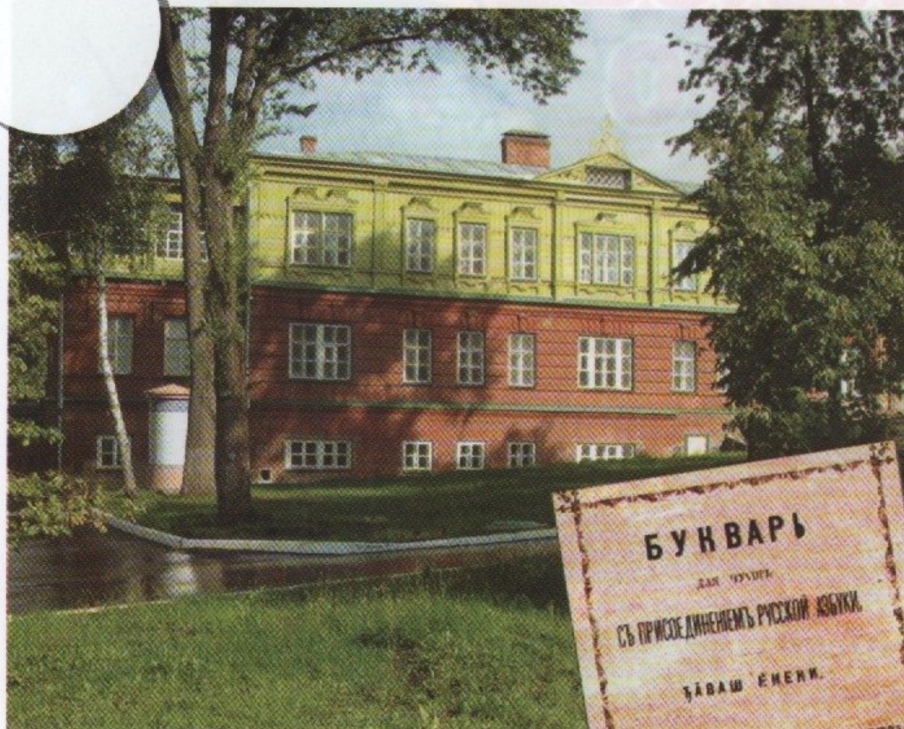
Музей «Симбирская чувашская школа»

Привет, дорогой читатель! Совсем скоро закончатся всеми любимые и самые длинные летние каникулы. А что ты успел сделать за это время? Где побывал? Что узнал нового? Сколько книг прочитал? А помнишь свою первую книгу, с которой ты познакомился в школе? Наверняка, это были азбука или букварь. Кстати, букварей в истории человечества очень много. Сколько народов – столько и таких учебников. Но сегодня мы поговорим лишь об одном – чувашском. Он празднует в этом году юбилей – 145 лет.