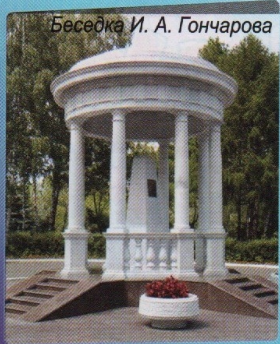
Беседка И. А. Гончарова